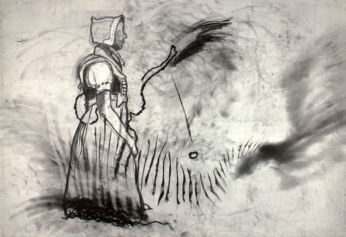
Maja Nagel, „es sollte nicht sein“, 2018, Kohlezeichnung, 61 x 86 cm