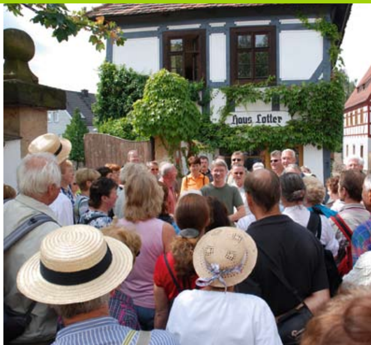
Radebeuler Begegnungen 2009 Wissenswertes zu Haus Lotter