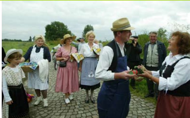
Radebeuler Begegnungen 2005 Übergabe des Staffelstabes